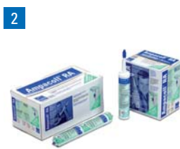
2 Ampacoll® RA: Colle liquide