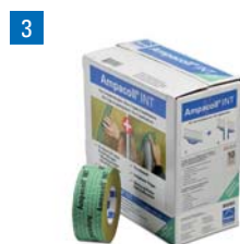
3 Ampacoll® INT: Ruban adhésif acrylique