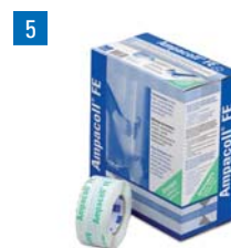
5 Ampacoll® FE: Ruban pour la pose des fenêtres