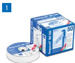
1 Ampacoll® BK 535: Ruban adhésif en caoutchouc butyle