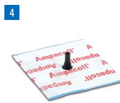
4 Ampacoll® Elektro / Install: Manchettes