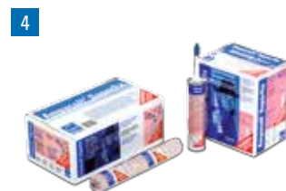
Ampacoll® Superfix: Colle liquide