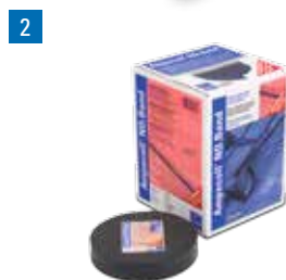
Ampacoll® ND.Band: Bande d'étanchéité pour clous