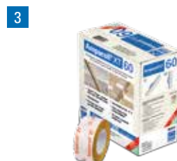
Ampacoll® XT 60: Ruban adhésif acrylique