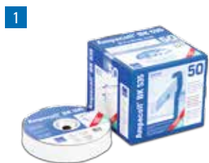
Ampacoll® BK 535: Ruban adhésif en caoutchouc butyle