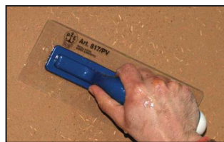
Étape 3 - à mi-séchage, resserer l'enduit à l'aide d'une spatule plastique souple.