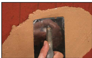
Étape 1 - application directe sur brique plâtrée légèrement humidifiée (pas de sous couche de fond ou d'accroche)