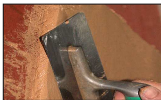
Étape 2 - application à la spatule inox ou à la machine à projeter, sur 1cm d'épaisseur.